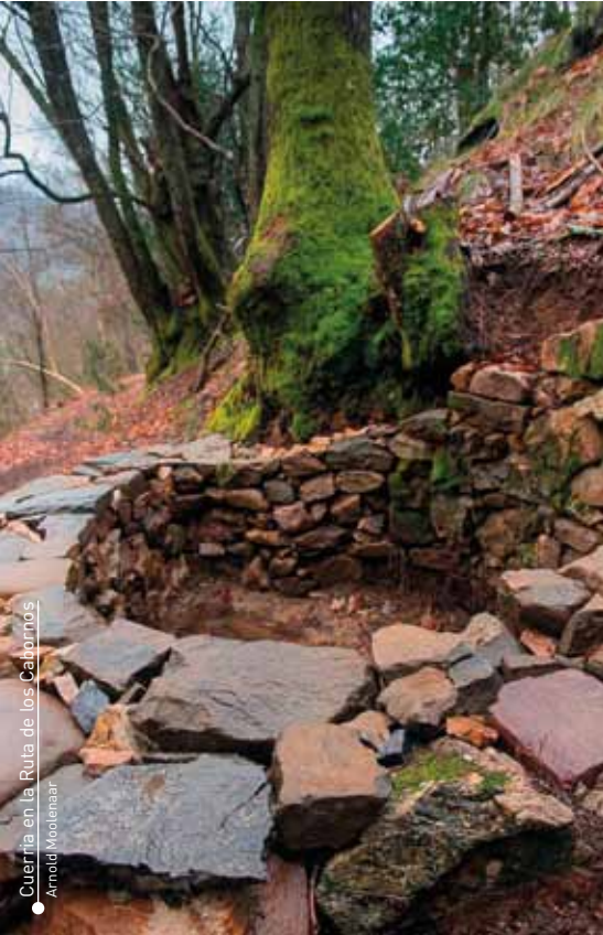
Cuerría en la Ruta de los Cabornos Arnoldi Moleenaar

por un magnífico itinerario hacia la primera población: Orlé. A pocos kilómetros del inicio, encontramos en la margen derecha de la carretera una senda que conduce al área recreativa de la Collada de Pandu.