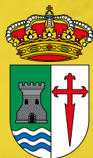
Ayuntamiento de Sobrescobio