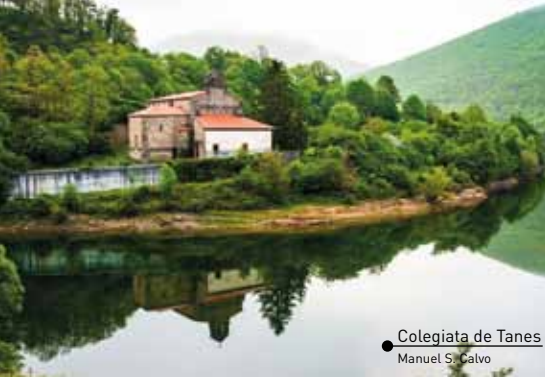
Colegiata de Tanes Manuel S. Calvo

situado en la margen izquierda de la carretera, frente a las tranquilas aguas del embalse. En la margen derecha, un sendero conduce hasta la Colegiata de Santa María La Real, data del año 1550 y sufrió diversas transformaciones hasta el siglo XIX. Tras pasar la Colegiata un desvío a mano izquierda conduce al pueblo de Abantro, solar de una antigua cantera, hoy en día cerrada, que dejó su impronta en las sólidas construcciones que tiene este magnífico conjunto etnográfico. Continuamos el recorrido y encontramos una desviación a la izquierda que nos dirige a las localidades de Prieres y Gobezares, que conservan excelentes muestras de la arquitectura rural y tradicional asturiana.