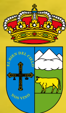
Ayuntamiento de Caso